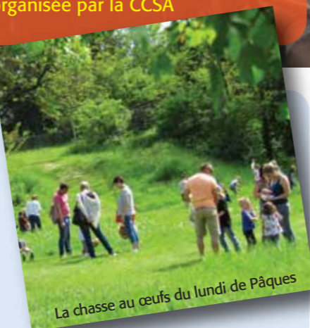
La chasse au œufs du lundi de Pâques

Comité des Fêtes de Saïx Dimanche 16 juillet Edition 2017 des « Arts en Fête » à Massaguel organisée par la CCSA