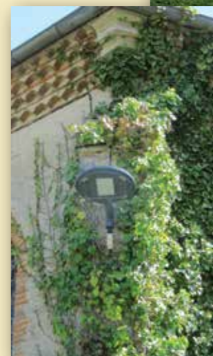
Les premières lampes à LED ont été installées à Longuegineste

EXTINCTION DE L'ÉCLAIRAGE PUBLIC DE MINUIT À 6H