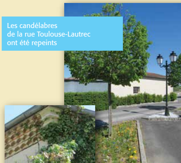
Les candélabres de la rue Toulouse-Lautrec ont été repeints

Donc le soir du 21 juin 2017, nous invitons à la plus grande prudence les noctambules pour le retour de la fête de la musique.